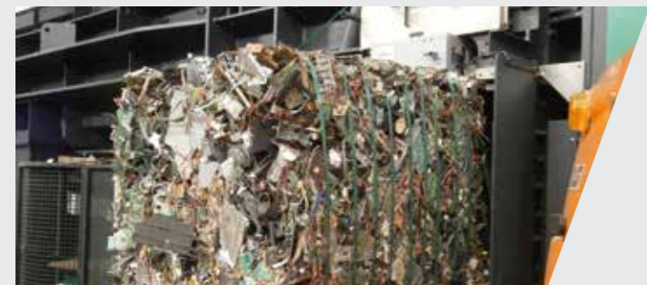
Déchets d'équipements électriques et électroniques (DEEE) : cartes électroniques, plastiques... Waste electric and electronic equipment (WEEE): E-cards, plastics...