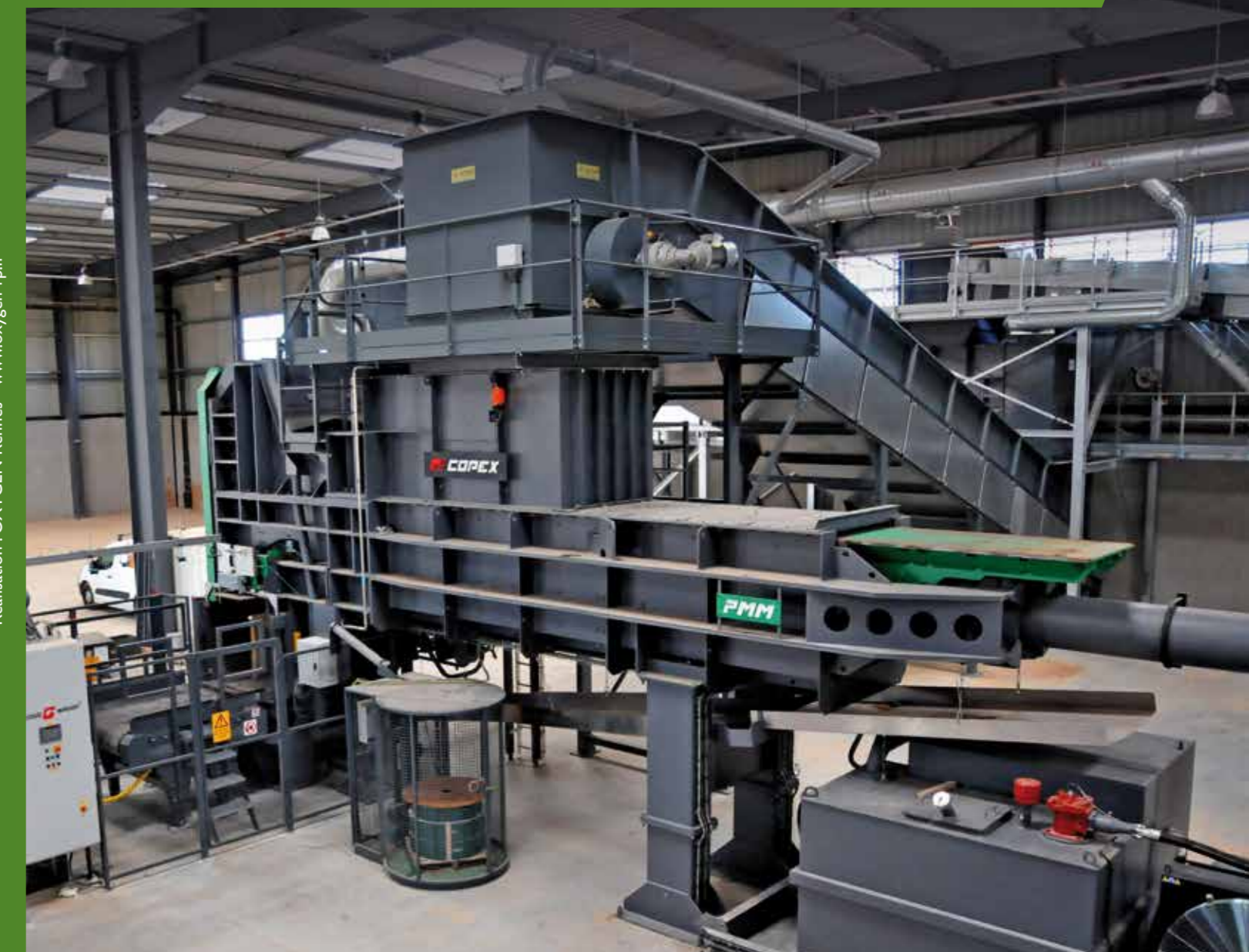
Réalisation : OXYGEN Rennes - www.oxygen-rp.fr

Solutions de compactage pour les matériaux solides Solid Waste Recycling Solutions