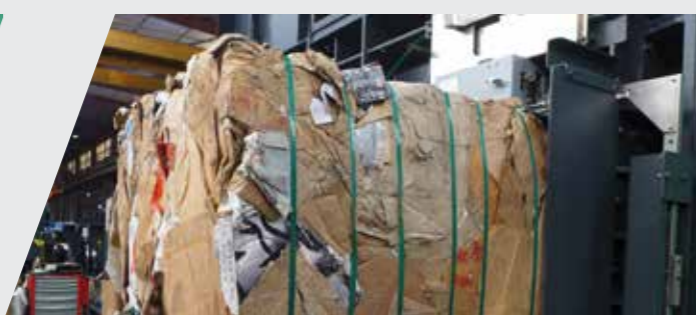
Papiers et cartons Paper and cardboard