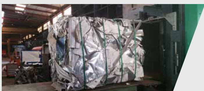
Aluminium, ferraille légère, encombrants Aluminium, light scrap, bulky