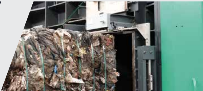
OMR, DIB, refus de lignes de biodéchets... MSW, ICW, waste refuse from biomass processing lines...