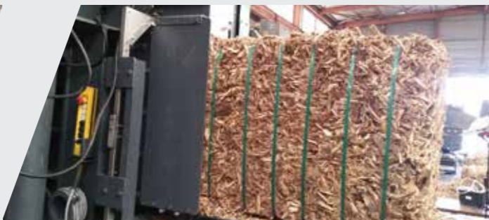
Bois énergie Fuelwood energy