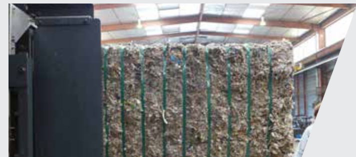
Combustibles solides de récupération (CSR) Refuse derived fuel (RDF)