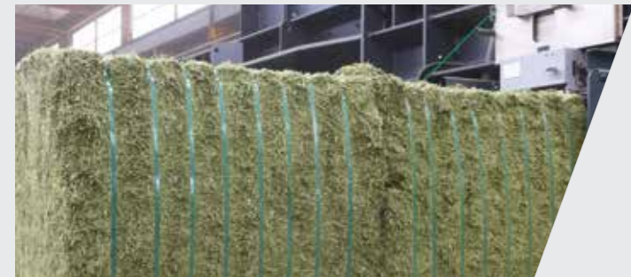
Fibres végétales, textiles... Vegetable and textile fibers...

Offrant une très grande polyvalence, elle permet de traiter la quasi-totalité des matériaux compressibles :